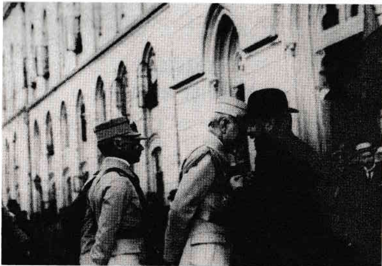
Brătianu, gen. Constantin Prezan și gen. C. Cristescu